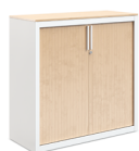
Portes à rideau