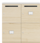
Fente à lettres et porte-étiquette