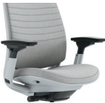
Brazos (1D, 4D, sin brazos)