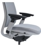
Ángulo de asiento ajutable*