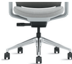
Base de aluminio pulido