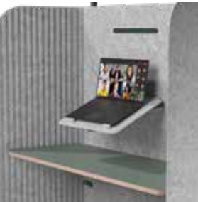
Bandeja plegable para portátil (PET)