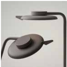
Lámpara Steelcase Eclipse Light