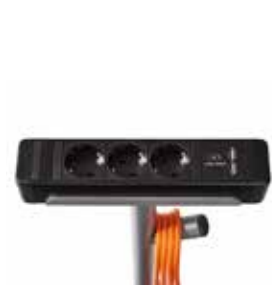
Compacto con base Steelcase Flex