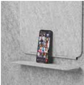
Bandeja fija (PET)