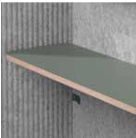
Superficie de trabajo