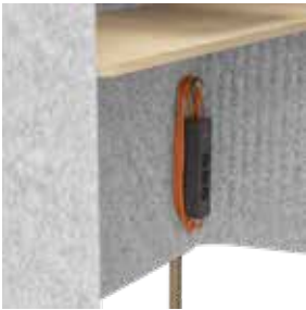
Compacto de electrificación suspendido Steelcase Flex