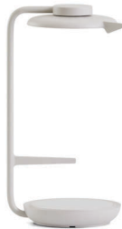
Eclipse Light im Modus für Fokussarbeit