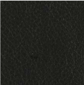
LQU01 Black Leather