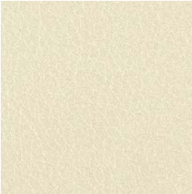
LQU09 White Leather