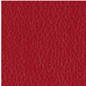
LQU08 Red Leather