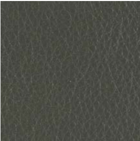
LQU05 Grey Leather