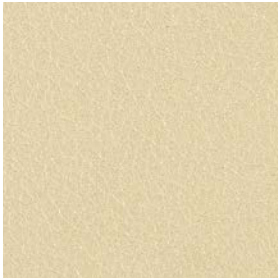
LQU06 Ice Leather