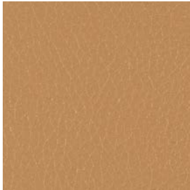
LQU07 Nougat Leather