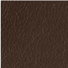
LQU02 Brown Leather