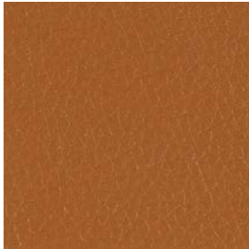
LQU03 Cognac Leather