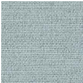
FBA04 Dust Green