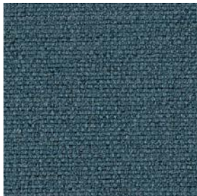
FBA03 Dust Blue