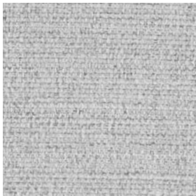
FBA06 Light Grey