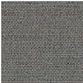
FBA02 Dark Grey