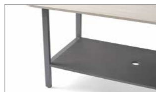
Repose-pieds en MDF