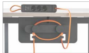
Crochet avec boîtier à suspendre Flex