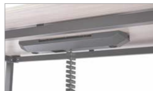
Goulotte + montée de câbles