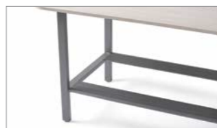
Repose-pieds en aluminium