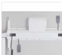
Gestion des câbles