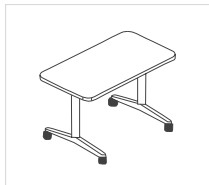
Rectangulaire H740 mm

L1200 x P650 mm L1400 x P700 mm L1400 x P650 mm L1500 x P700 mm L1500 x P650 mm L1600 x P700 mm L1600 x P800 mm