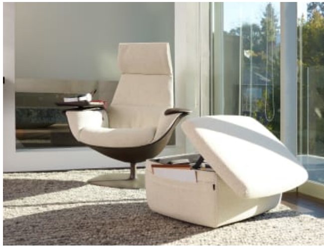
Coalesse Massaud 休息室