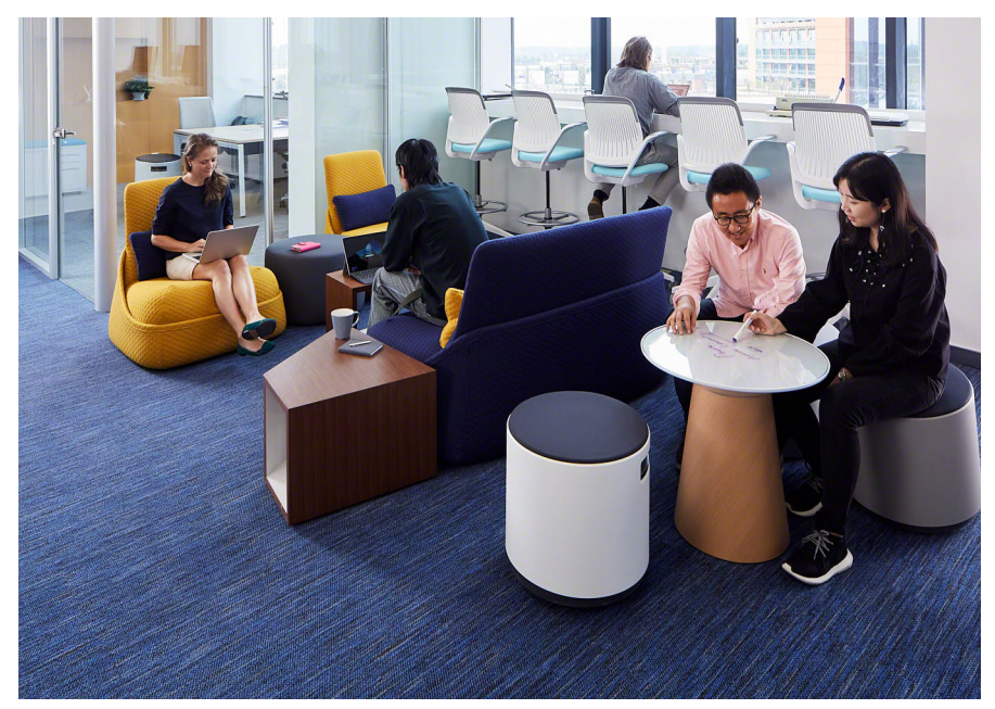
全新的教师休息室环境舒适,促进教师交流之余,更让他们重拾干劲。他们可在休息室规划 课堂、静思、互助指导和联谊,并使用工作工具和电源。休息室内有不同家具可供教师自由 选择, 支持不同活动及姿势, 保持身心健康。

现在, 学生必须学会平衡数字科 技与人的结连。尽管置身网络世代, 动觉型学习依然极具价值。Steelcase Education解决方案保留实体学习工具, 让师生可以随手取用, 像是Verb白板、 小型易擦白板等等, 既适合个人学习, 亦适合小组共用,还能鼓励更多内向 的学生分享想法。根据加州大学洛杉 矶分校的调研, 手写笔记比打字更能 提升学习成效,有助梳理艰深概念; 乱写乱画更是充满创意的试错学习过程, 而学生以这种方式参与课堂或探索学科, 最是自然不过。Campfire Paper Table 表面可供书写,同时提供笔记纸张,让学 生将想法写出来与分享、彼此交流。