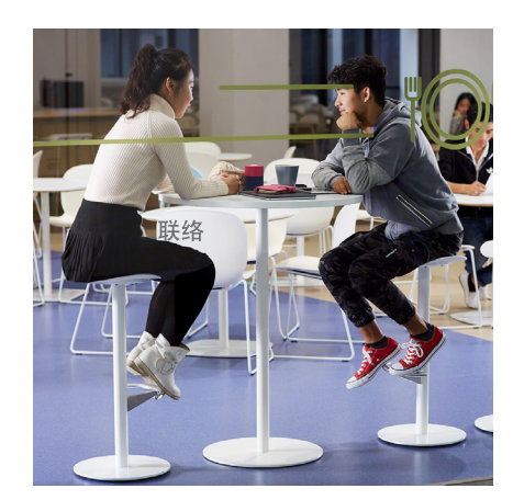
饭堂环境轻松悠闲, 促进社交联络。 校内任何空间都是学习空间。

饭堂的食物促进学生身心健康, 环境更是轻松悠闲,配备适合不同人 数组合的餐桌餐椅。模块化家具、 高椅和高桌,不仅与富现代感的共享 用餐环境互相呼应,亦有助师生在 这热闹亲和的空间锻炼社交技能。